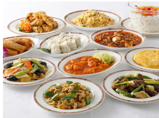
中国料理メニュー例