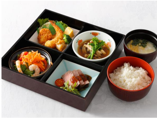
松花堂弁当 梅 洋食 1名様2,500円