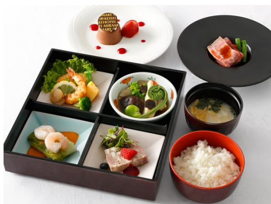
松花堂弁当 松 洋食 1名様3,500円