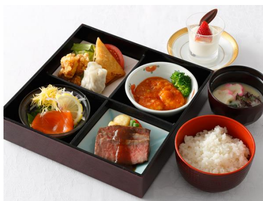
松花堂弁当 竹 洋中 1名様3,000円