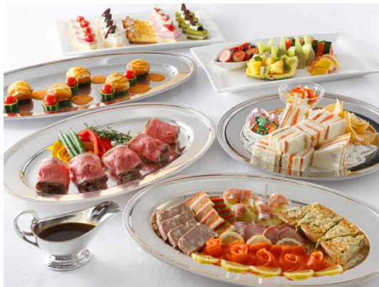
洋食メニュー例(各5名様)