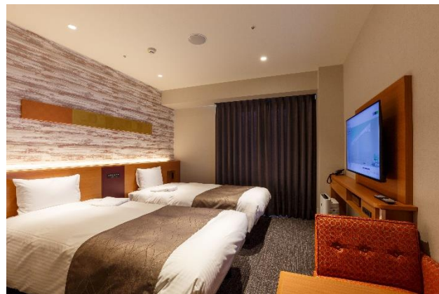
抽選で当たる客室 例:アネックスツイン

今回が初の開催となる「イースターエッグハント」は、ヒントをもとにホテル館内と千葉中央駅周辺施設に設置されたイースターエッグを探し、キーワードを集めた先着85名様に賞品が当たり、さらに抽選で宿泊券等が当たる体験型イベントです。京成千葉中央ビルのグランドオープンから半年を迎え、さらに多くの皆様に千葉中央エリアに親しんでいただくため、周辺に所在する京成グループ各社と連携して開催しています。