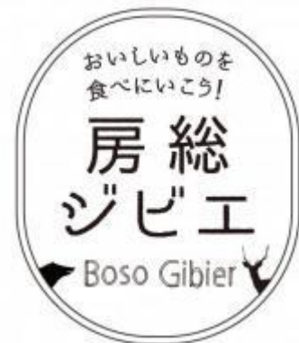
房総ジビエ ロゴマーク