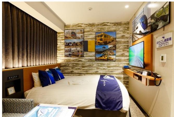
▲京成の電車をテーマにしたコンセプトルーム

2022年7月からの販売以降約5ヶ月で延べ263名のお客様が宿泊され(12月5日現在)、「子供も大人も楽しめる部屋だった」「実物が触れてよかった」「電車が部屋から見られて素敵だった」などのお声と継続販売のご要望をいただき、この度、販売を再延長することを決定いたしました。2023年1月1日(日)からのご予約は、本日12月19日(月)より承ります。