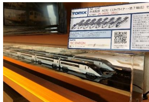
▲最新型Nゲージ 「TOMIX 京成電鉄 AE形 (スカイライナー・第7編成)セット」