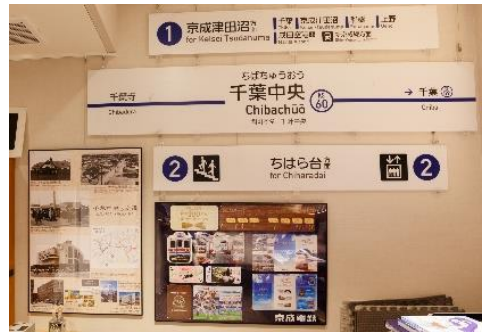
▲駅看板や記念乗車券などの展示