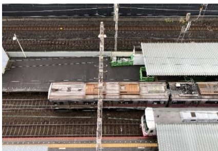
▲客室窓からのトレインビュー