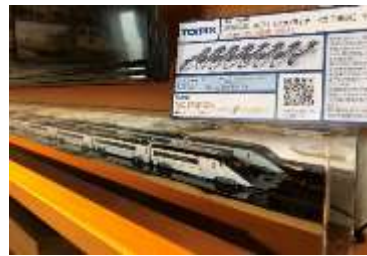
▲ 最新型Nゲージ 「TOMIX 京成電鉄 AE形 (スカイライナー・第7編成)セット」