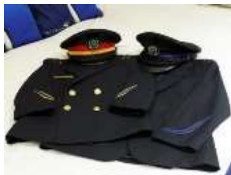
▲ お子様用制服の貸出