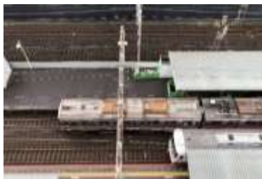
▲ 客室窓からのトレインビュー